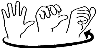
Hands for 1